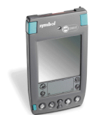
Ordinateur bloc-notes SPT 1500 à base de OS MD