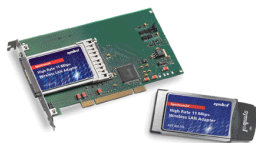
Cartes PC et PCI sans fil à débit élevé 11 Mps