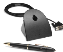
Numériseur manuel CyberPen