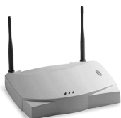
Point d'accès sans fil à débit élevé 11 Mps

«La moyenne de temps de travail manqué à cause du stress, de la fatigue ou des burn-out est en hausse de 35% depuis 1995»